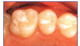
Fertige Versiegelung im Mund

In der Regel kann man von einer 2-4 jährigen Haltbarkeit ausgehen. Versiegelungen können ohne weiteres wiederholt werden.