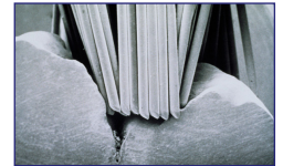
Fissur/Borsten unter Mikroskop

Die besonders kariesgefährdeten Stellen der Zähne werden mit einer Schutzschicht überzogen (versiegelt) und so vor Karies geschützt.